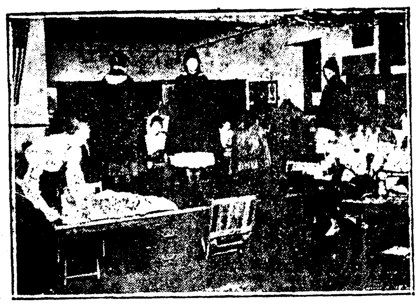
Throughout the length and breadth of the land, Junior Red Cross girls have made garments for war refugees in the Household Arts departments of their various schools as a part of the regular work. The camera caught these juniors as they were trying on capes they had just finished.

Write your name and address plainly and enclose this coupon to your letter.