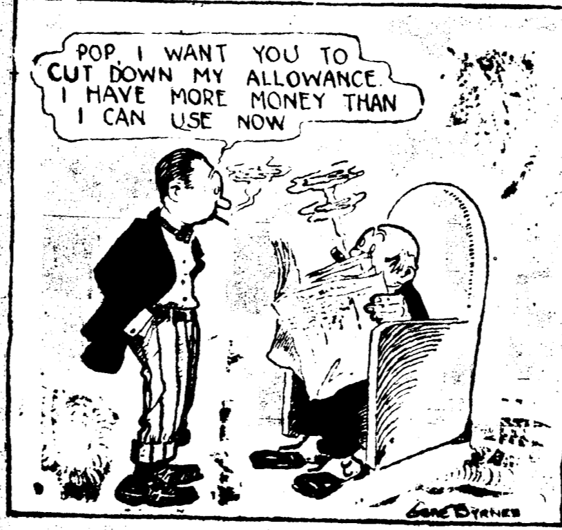
Pop, je veux que vous baisiez mon salaire. J'ai plus d'argent que j'peux dépenser.