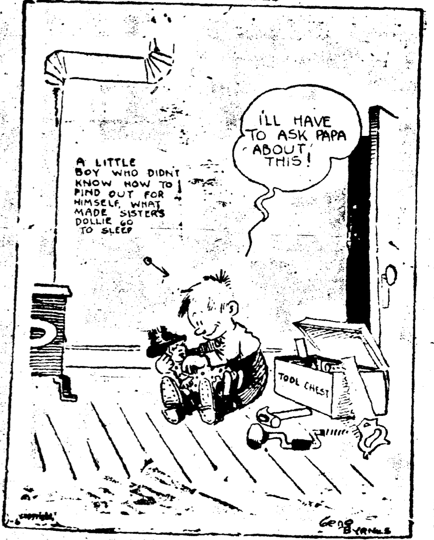
Il me faut demander papa ce que cela veut dire. Un petit garçon qui ignorait comment savoir, ce qui faisait Sisters Dollie s'endormir.