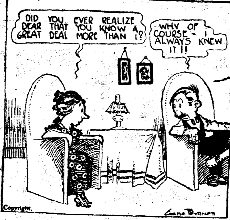
Savais-tu cher, que tu connais plus que moi? Sans doute, je le savais toujours.