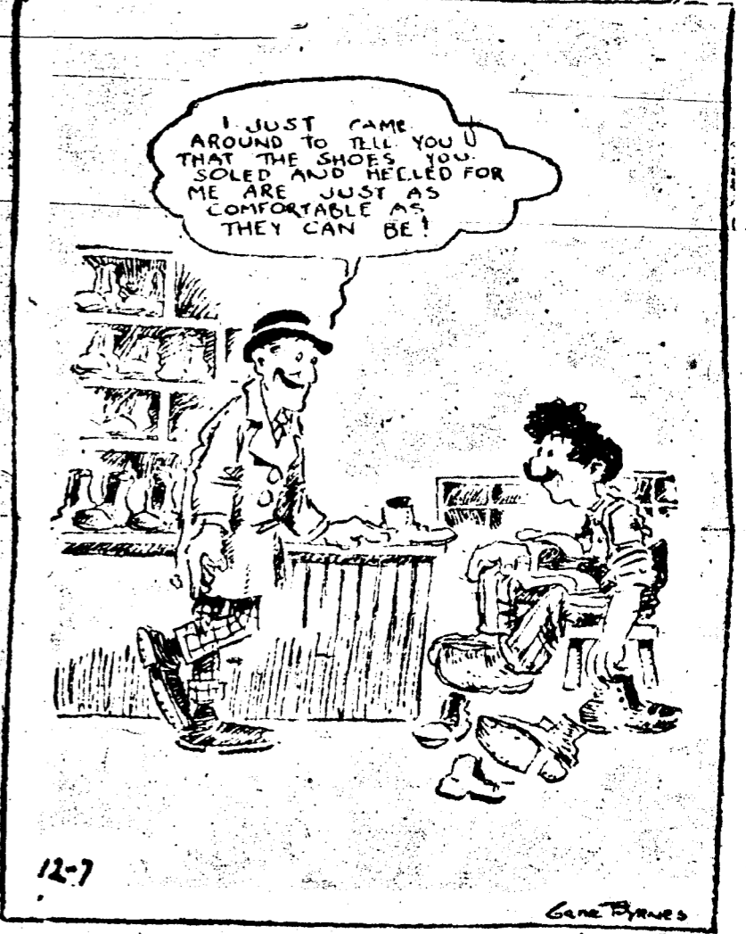
Je viens seulement pour vous dire que mes souliers raccommodés par vous, sont aussi confortables qu'ils puisse n'être.