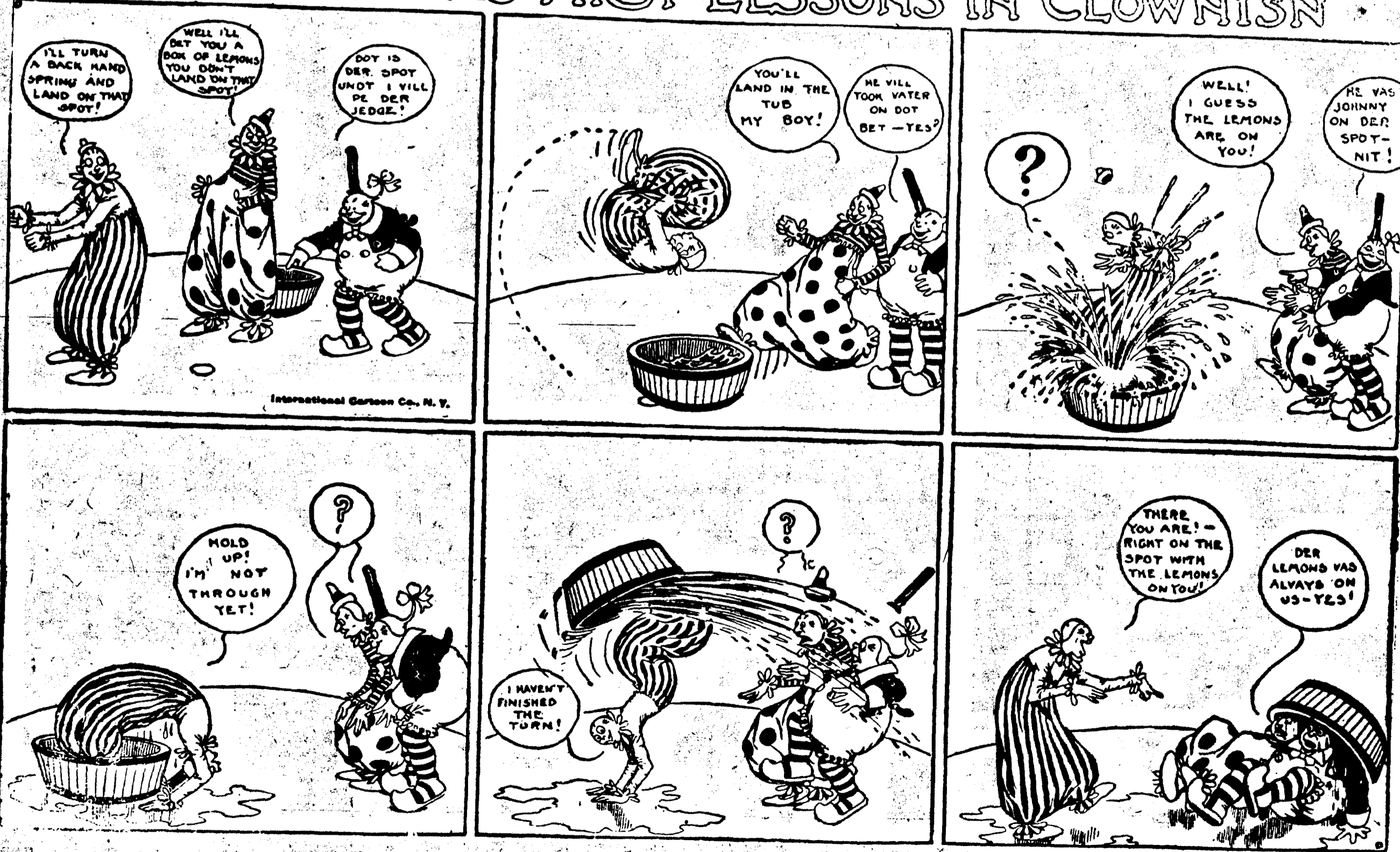
No. 1. Simon prend des leçons de clownerie.