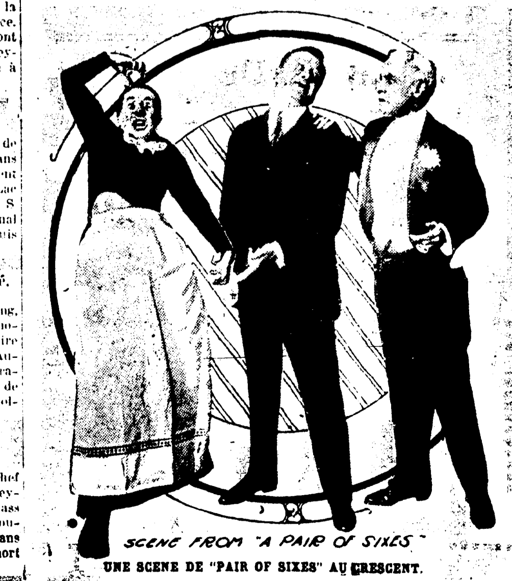
SCENE FROM "A PAIR OF SIXES" UNE SCENE DE "PAIR OF SIXES" AU CRESCENT.