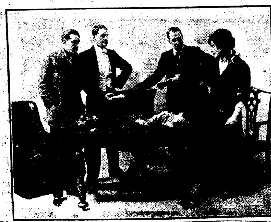
UNE SCENE DE L'ACTE I DU DRAME "OUTCAST".