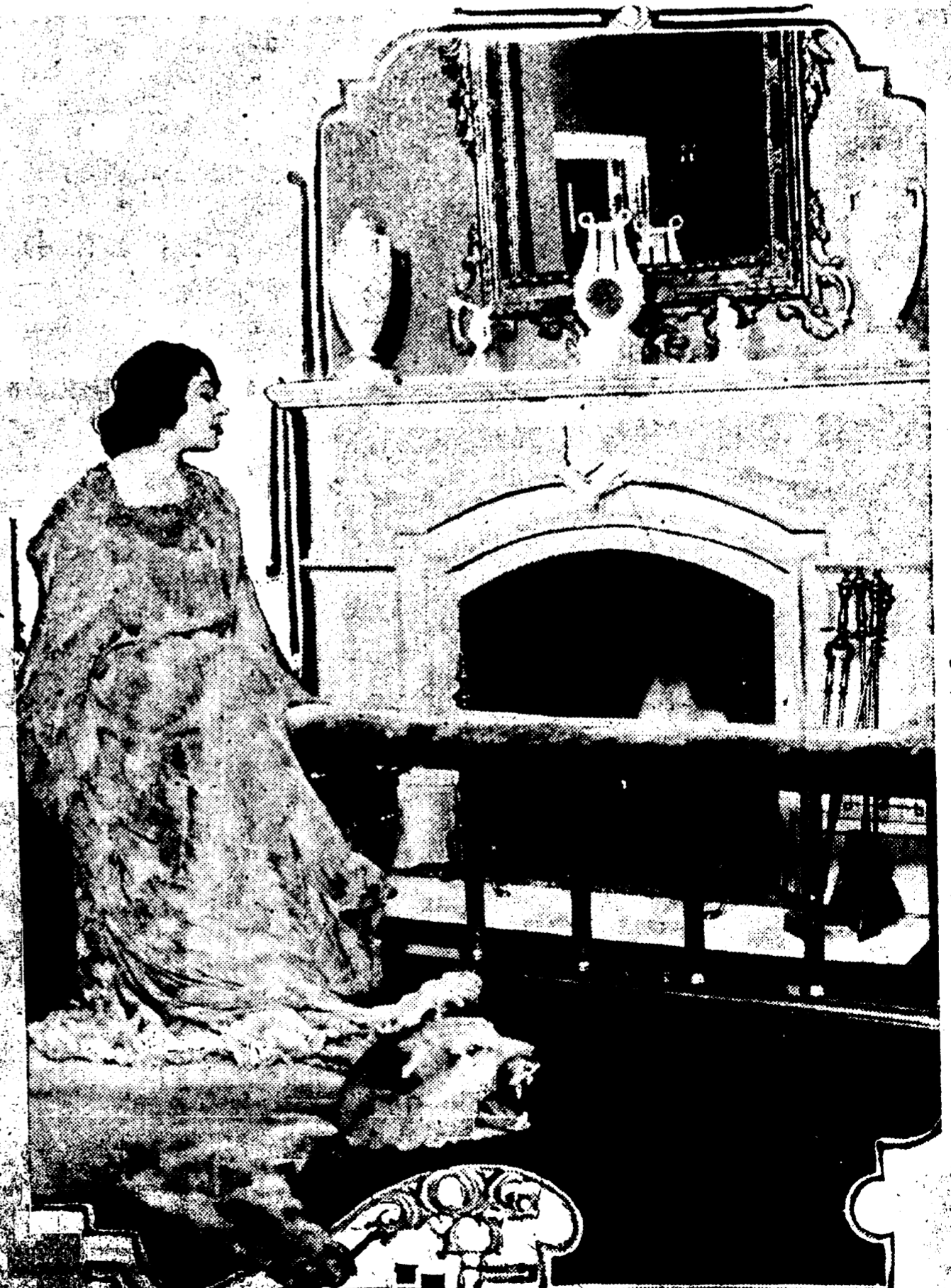
NAZIMOVA, A L'ORPHEUM.