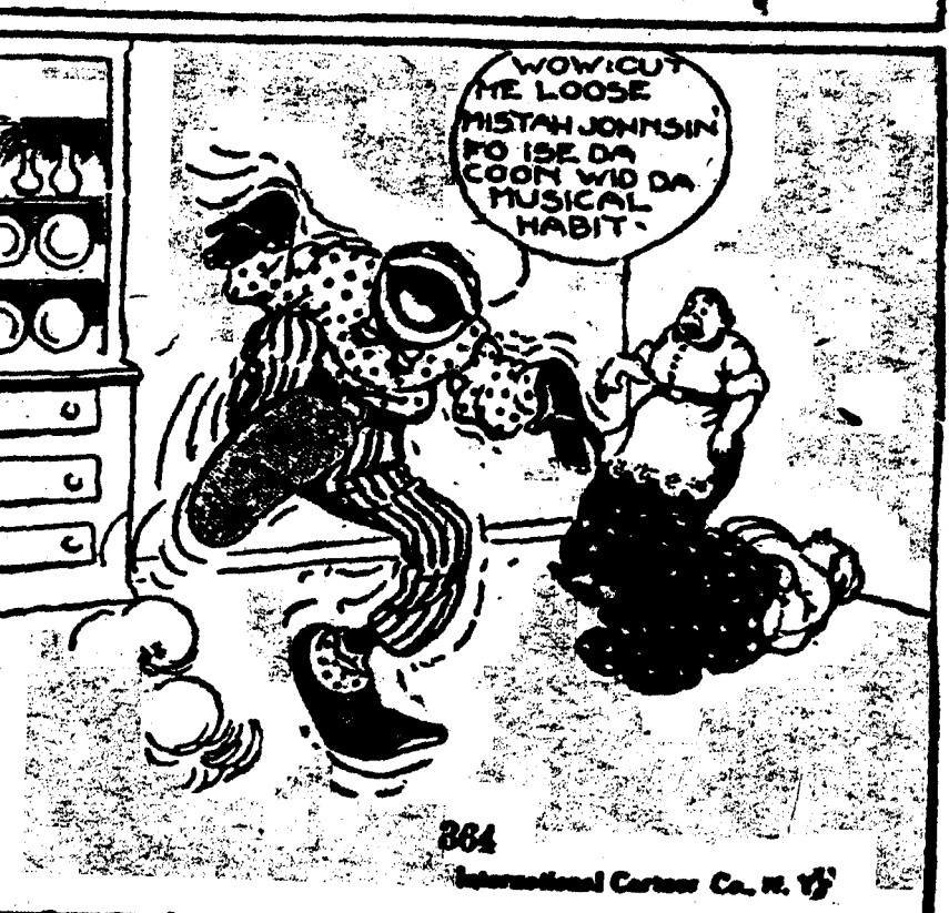
1. Le Nègre—Moi à la voix musicale, mam'zelle. La Dame—Tu l'exprimer si gentiment que je t'engage.