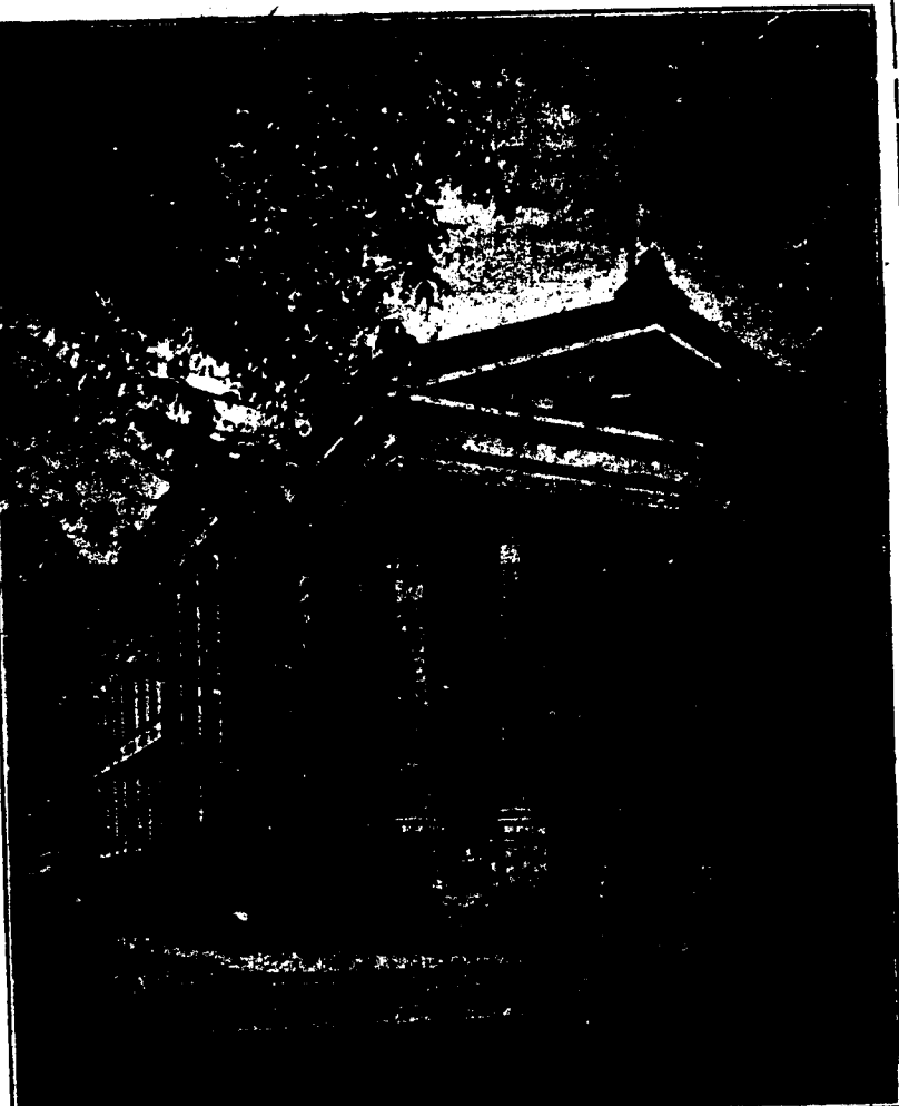
Hotel de Ville

Le café qui a fait le renommé de la Nouvelle-Orléans