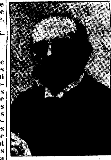
M. JULES CAMBON.

Dépêche Spéciale à l'Abeille. Pékin, Chine, 6 août. — Le gouvernement de la Chine a proclamé sa neutralité dans la guerre européenne.