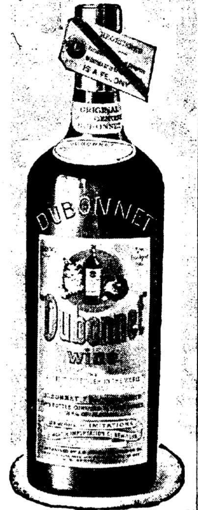
Insistez sur l'original "DUBONNET"

Vendu dans tous les hôtels, restaurants et clubs de la Nouvelle-Orléans et aussi par tous les marchands de vin et les épiciers