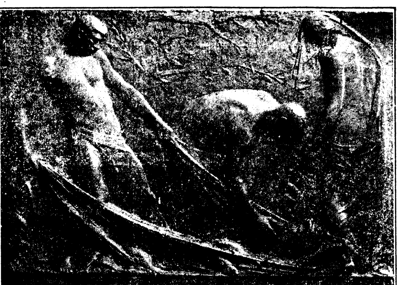
RELIEF AU THÉÂTRE D'OSTRAU, "LA MORT D'ORPHÉE"

Berlin. — Les automobilistes qui voyagent en Allemagne ne sont pas rassurés. Dans la nuit du 10 juin un attentat semblable à celui qui coûta la vie, il y a deux mois, à M. et Mme Plunz, a eu lieu sur la route de Berlin à Potsdam. Comme il y a deux mois, un énorme fil de fer tendu en travers de la route et attaché à deux arbres, aurait infailliblement causé la mort de plusieurs personnes si les criminels étaient arrivés un peu plus tôt. Un chauffeur de taxi menait deux femmes et un petit garçon de Berlin à Potsdam. Il filait à grande allure et à l'aller rien ne vint contrarier sa marche. A son retour il marchait à faible vitesse, quand, entre Wannsee et Charlottenburg sa machine se jeta sur un fil tendu en travers de