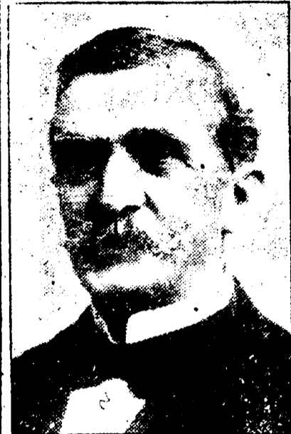
EMILE S. ECUIER, Président de l'Union Française.

DATES DES REUNIONS — Réunions le premier jeudi de chaque mois.