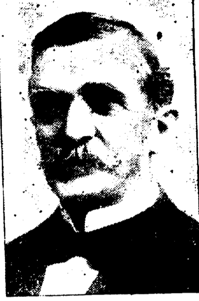
EMILE S. ECUVER Président de l'Union Française.

DATES DES REUNIONS — Réunions le premier jeudi de chaque mois.