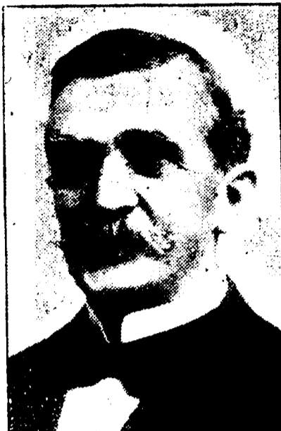
EMILE S. ECUYER Président de l'Union Française.

DATES DES REUNIONS — Réunions le premier jeudi de chaque mois.