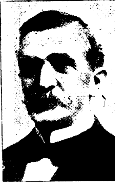
EMILE S. ECUYER Président de l'Union Française.

DATES DES REUNIONS — Réunions le premier jeudi de chaque mois.