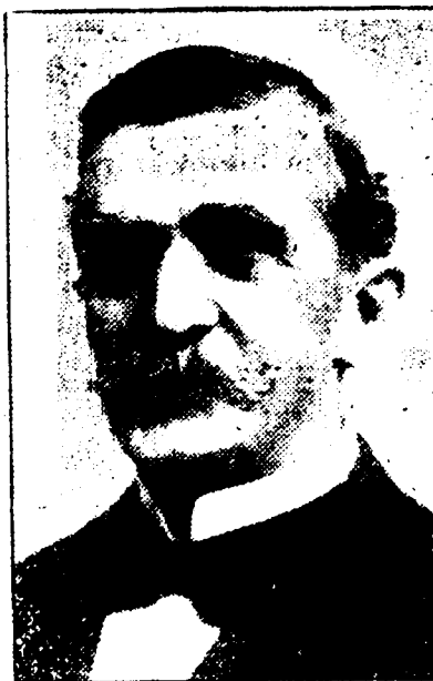
EMILE S. ECUYER Président de l'Union Française.

DATES DES REUNIONS — Réunions le premier jeudi de chaque mois.