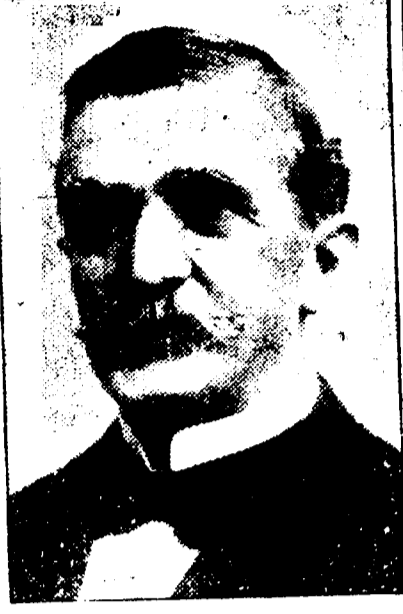
EMILE S. ECUIER Président de l'Union Française.

DATES DES REUNIONS — Réunions le premier jeudi de chaque mois.