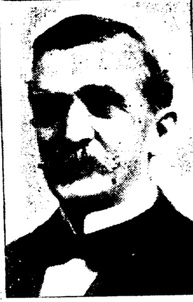
EMILE S. ECUIER Président de l'Union Française.

DATES DES REUNIONS — Réunions le premier jeudi de chaque mois.