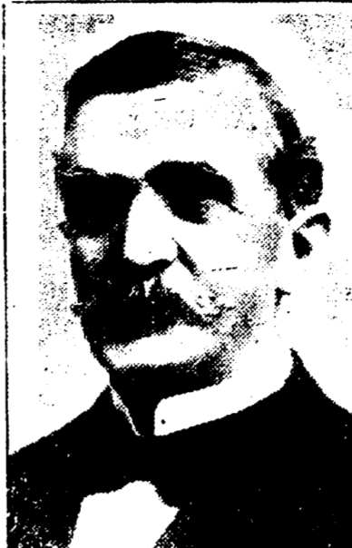
EMILE S. ECUIER, Président de l'Union Française.

DATES DES REUNIONS — Réunions le premier jeudi de chaque mois.