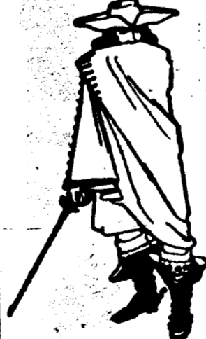
Nous Défions le Monde.

Préparations Françaises de Qualité Supérieure.