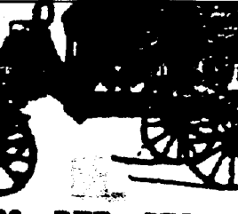
No 628 RUE STE-ANNE SALONS FUNEBRES. Téléphone No 1042.

Entrepreneur de pompes funèbres. No 628 RUE STE-ANNE, SALONS FUNEBRES.