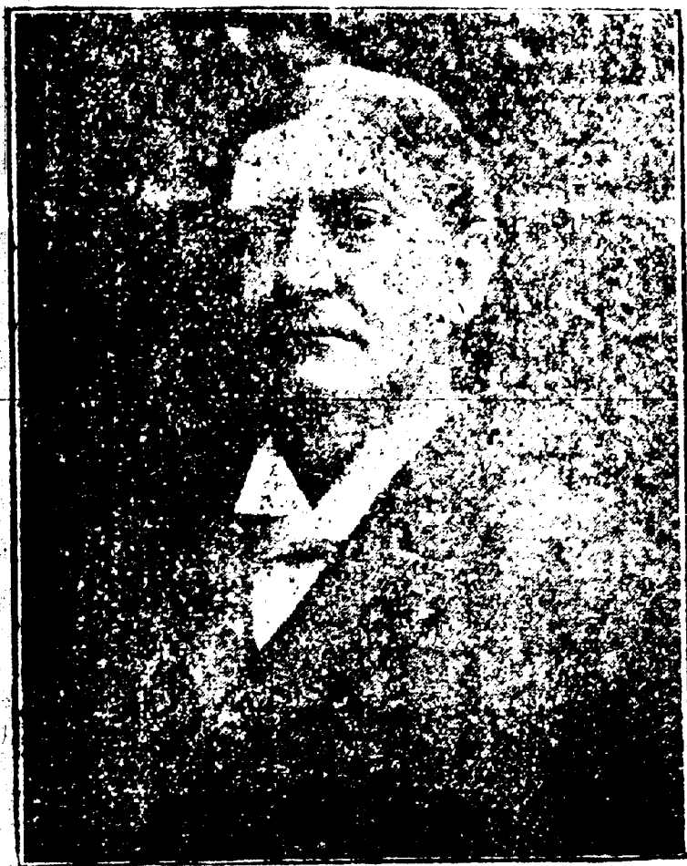
NEWTON C. BLANCHARD. Gouverneur de la Louisiane.