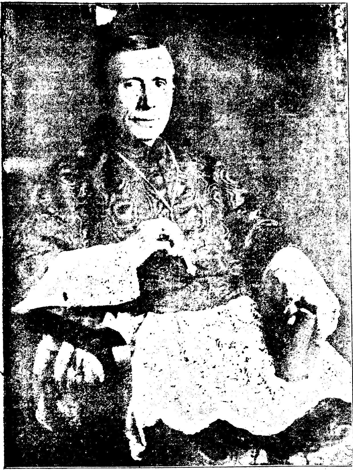
LE CARDINAL GIBBONS.