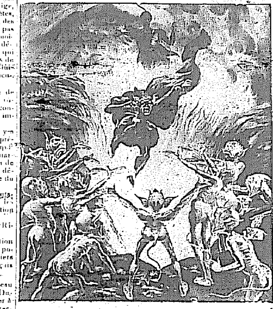
SCENE DANS "THE BLACK CROOK"