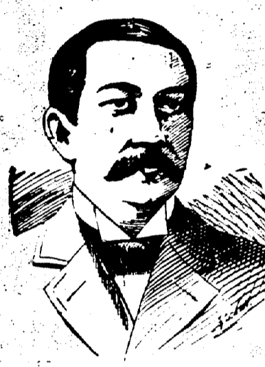
KOGORO TAKAHIRA. Ministre du Japon aux Etats-Unis.