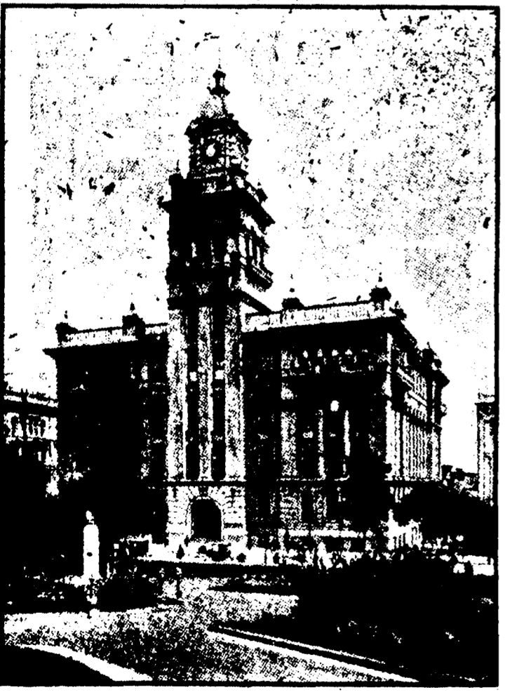
PALAIS DE JUSTICE, San Francisco, Californie.

Résolution adoptée par le Sénat. Washington, 19 avril.—Lorsque le Sénat a été appelé à l'ordre aujourd'hui, une résolution conjointe autorisant le secrétaire de la guerre à se servir des rations et provisions de l'intendance pour les victimes des régions dévastées par le tremblement de terre et l'incendie en Californie et à allouer la somme de $500,000 pour le secours de ces malheureux a été adoptée.