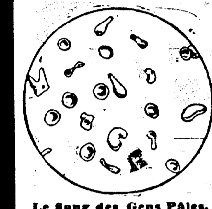
Le Sang des Gens Pâles.