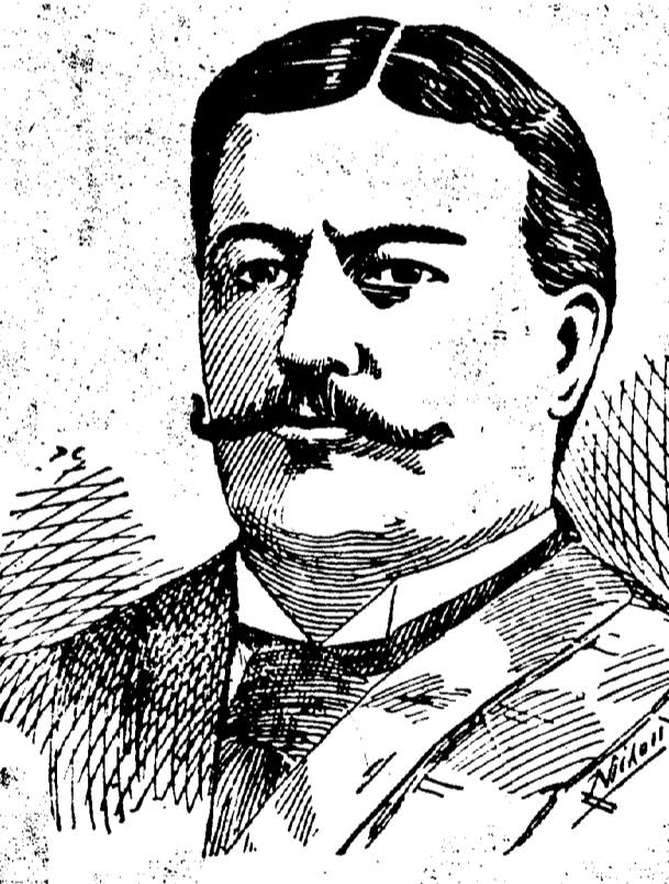
W. H. TAFT.

Hier matin, en présence des hauts fonctionnaires, des représentants de gouvernements étrangers et des Etats et des Territoires de l'Union, l'Exposition de St-Louis a été officiellement ouverte.