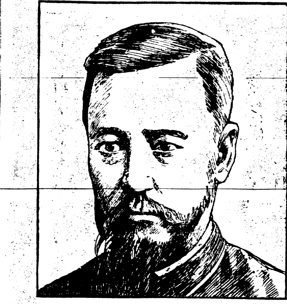
VICE-AMIRAL TOGO, Commandant de la flotte japonaise dans la Mer Jaune.