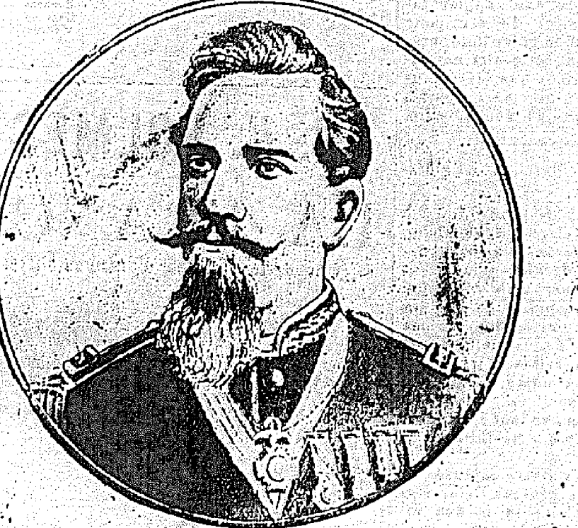
GEN. BERNARDO REYES.