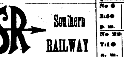
Tableau de cours pour les chemins de fer.

La Route de Chars sans Changement entre le Sud, le Sud-est et l'Est.