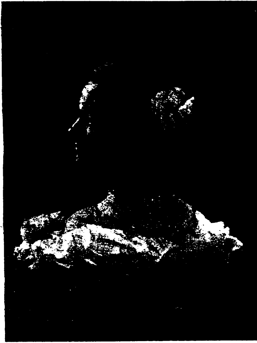
ROSALIE FEIBIGER Reine, 27 février 1900.