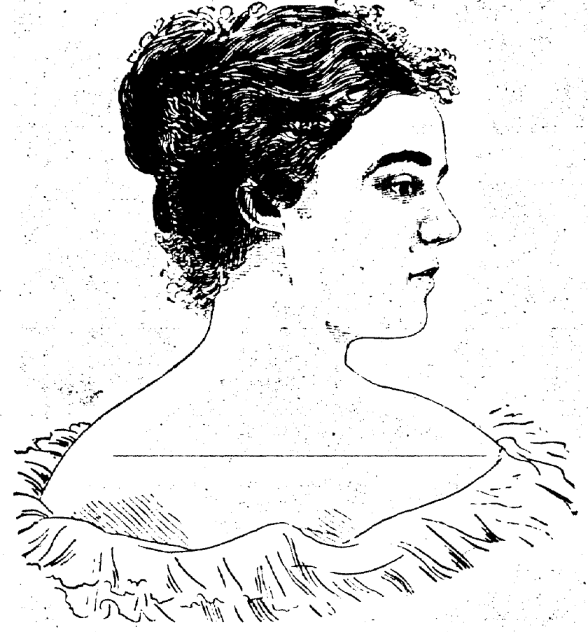
ETHELIN LALLANDE, Reine, 2 mars 1897.