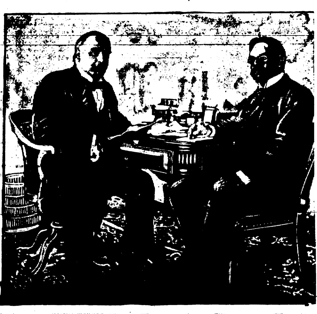
M. McKinley et son secrétaire, M. Cortelyou, d'après une récente photographie.

Le système humoral, quoique très compliqué, est parfaitement capable de prendre soin de lui-même et de se débarrasser de tout ce qui est nuisible.