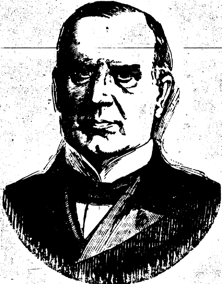
WILLIAM MCKINLEY. Président des Etats-Unis.