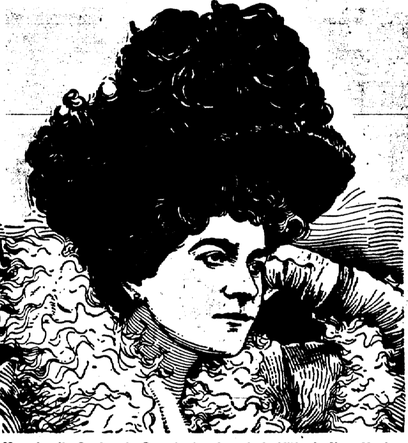
Mme Leslie Carter, la Grande Actrice, de la Ville de New York.

"Je ne voudrais pas pour un Million de Piastres avoir un Catarrhe", dit Mme Carter—Pe-ru-na est sa Sauvegarde.