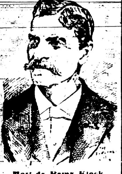
Mort de Reuby Klock

CELESTE-DECADE, lundi 5 novembre, à 6 heures P. M. à l'âge de 22 ans. MIOHEL, samedi 4 novembre, à l'âge de 22 ans.