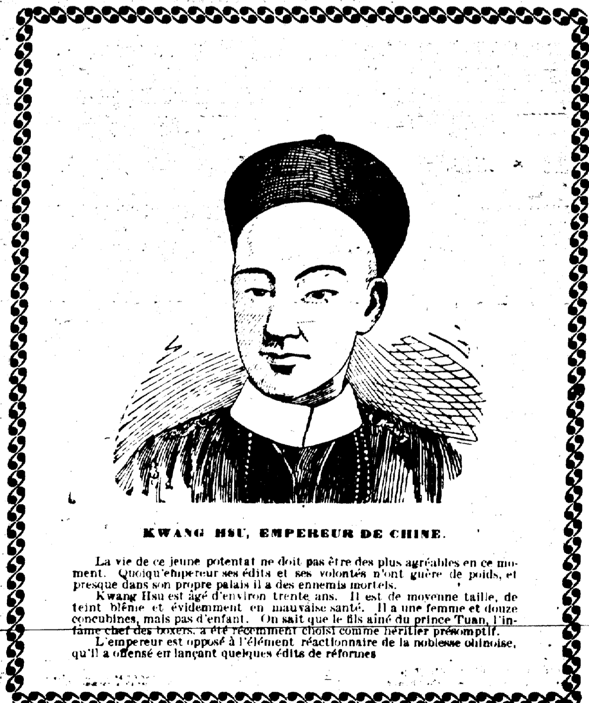
KWANG HSU, EMPEREUR DE CHINE.

La vie de ce jeune potentat ne doit pas être des plus agréables en ce moment. Quoiqu'empereur ses édits et ses volontés n'ont guère de poids, et presque dans son propre palais il a des ennemis mortels. Kwang Hsu est âgé d'environ trente ans. Il est de moyenne taille, de teint blanc et évidemment en mauvais santé. Il a une femme et douze concubines, mais pas d'enfant. On sait que le fils aîné du prince Tuan, l'infant-cher des boxers, a été récemment choisi comme héritier présomptif. L'empereur est opposé à l'élément réactionnaire de la noblesse chinoise, qu'il a offensé en lançant quelques édits de réformes.