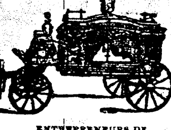
Entrepreneurs de Pompes Funèbres.