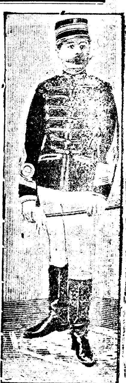
Le Colonel de Villebois Mareuil. Chef de l'état-major de l'armée des Boers, tué jeudi dernier près de Kimberly.