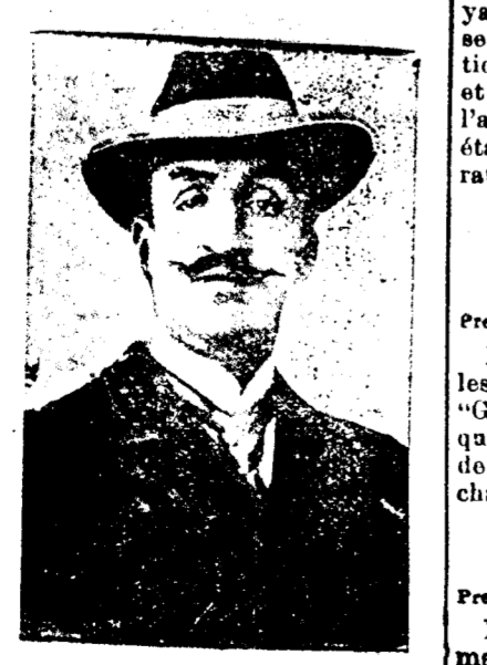
M. JULES GUÉRIN.

M. Deroulede a été relégué à la prison. M. Buffet s'est alors exprimé ainsi: «Vous m'avez porté un coup, merci! Vous avez condamné le gouvernement douze fois, et je vous remercie douze fois. Je ne veux pas bénéficier de la loi Bérenger. S'il y avait des démonstrations dans les rues demain j'y prendrais part. Je ne veux pas de pitié ni d'indulgence.»