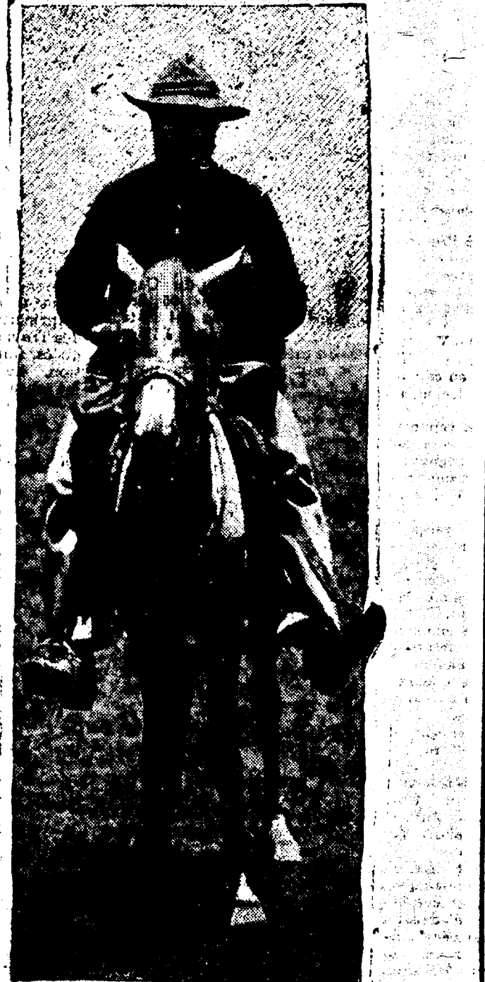
UN CAVALIER BOER.

La dernière dépêche de Mafeking dit que quoique les Boers s'agitent beaucoup dans le voisinage de leur laager, rien n'indique encore qu'ils se disposent à traverser la frontière.