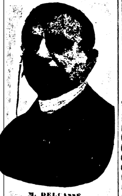
M. DELCASSÉ, Ministre des Affaires étrangères de France.

Les commissaires espagnols sont arrivés les premiers, accompagnés par l'ambassadeur d'Espagne à Paris, Señor Leon y Castillo, et par le secrétaire de l'ambassade.