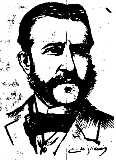
Le général WEYLER.

Pendant la dernière audience que lui a accordée la reine régente le général Weyler a protesté contre les colormes dont il est l'objet. Il a ajouté : Au-dessus de tout je suis un soldat, et je défendrai vaillamment les institutions de mon pays et la maison royale.