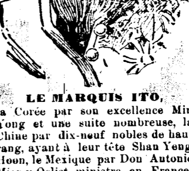
Le marquis Ito

vous vie se prolonger, et puissent la paix, l'honneur et la prospérité régner sur le peuple que vous avez été appelé à gouverner.