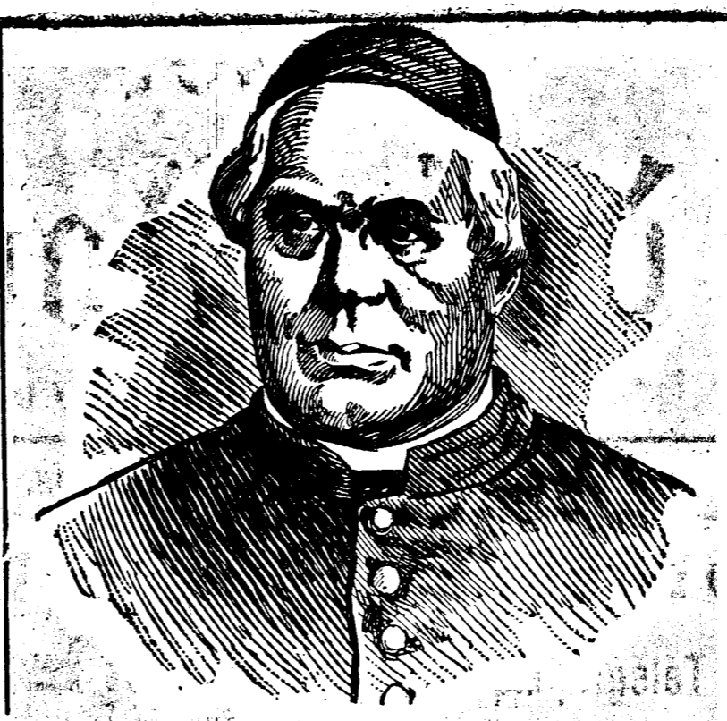
Mort du Père Sébastien Kneipp.