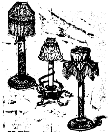
ONE UP TO DATE.

When transparent fabrics, such as chiffon or mousseline de soie, are employed for the shades, they should be mounted on very thin bristol board cut circular in shape and joined in the back by thin brass headed nails. An effective candlestick is one of silver with leaflike decoration. It is crowned by a shade of Moorish design. This shade is made of satin covered cardboard painted in a scroll design and thickly set with small imitation gems. The fringe ornamenting the edge is composed entirely of crystal beads in every imaginable color. This shade, as may be imagined, is one of the most beautiful of those imported this year, and yet it is made very easily.