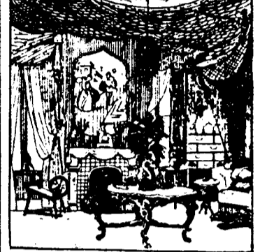
CORNER IN A CINDERELLA ROOM.

Attention is also called in The Puritan to the pleasing custom of the woman's