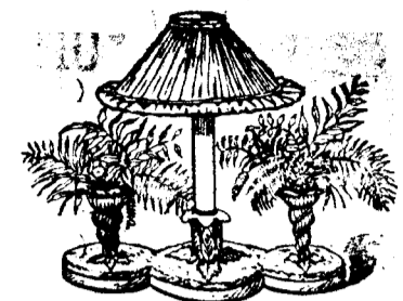
FERNERY AND CANDLELARA.

The innovation of the pretty candle accessories known as shades was, of course, a woman's invention. As rumor has it, evening after evening one of society's favorites sat chatting at the