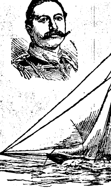
Le "Météore," yacht de l'Empereur Guillaume.