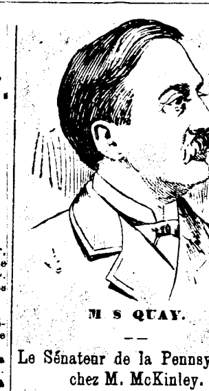
M. S. QUAY. Le Sénateur de la Pennsylvanie chez M. McKinley.

Berlin, 22 mai.—Le gouvernement est prêt à abolir entièrement les primes accordées aux exportateurs de sucre, pourvu que les autres puissances ne s'opposent pas à l'abolition de la prime en Allemagne. Le gouvernement est prêt à abolir entièrement les primes accordées aux exportateurs de sucre, pourvu que les autres puissances ne s'opposent pas à l'abolition de la prime en Allemagne.